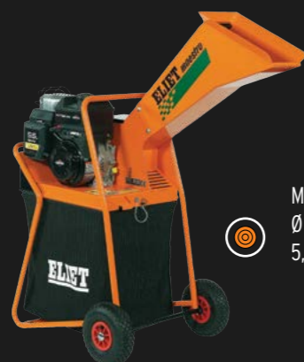
MAESTRO Ø 40 mm takdikte 5,5 pk