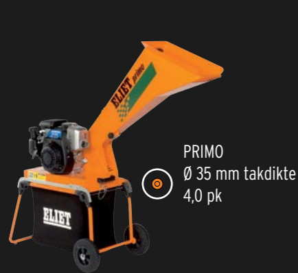
PRIMO Ø 35 mm takdikte 4,0 pk